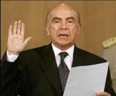
PEDRO "EL BREVE" CARMONA

El pacto de punto fijo no ha sido el único intento de control partidista y sectario que ha atentado contra la democracia y la libertad en Venezuela; antes y después de este, la mas famosa de las infamias contra el orden democrático en la nación, ha habido pactos igual o mas descabellados que violaron los derechos de un pueblo a elegir libremente.